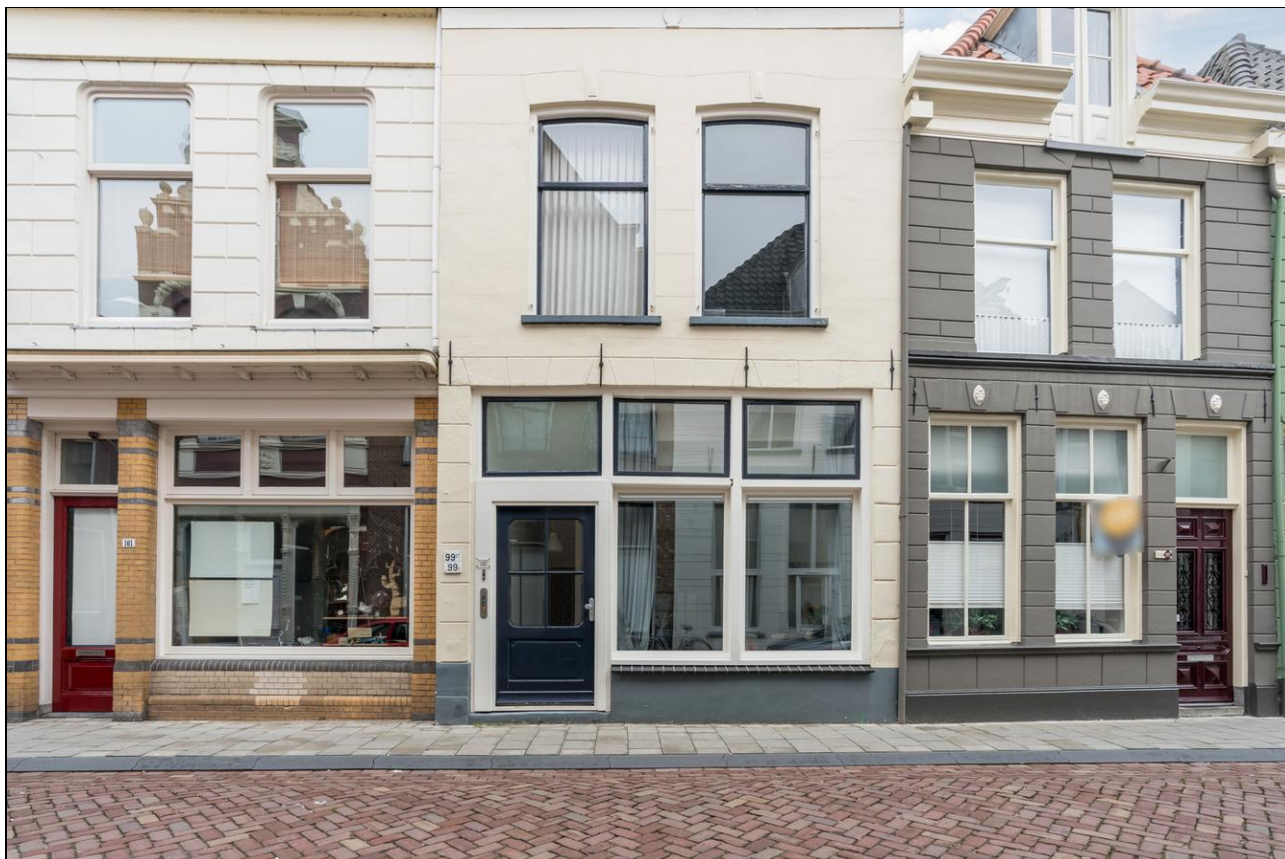
Boven Nieuwstraat 99, 8261 HC Kampen